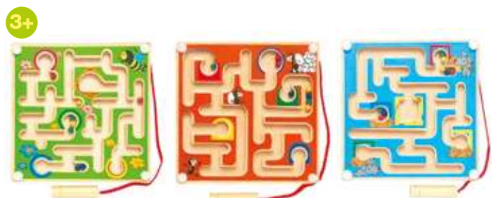
90344 Magnetický minilabyrint s kuličkou zelený/oranžový/modrý Magnetic mini-labyrinth with ball green/orange/blue → 12x12x1,1 cm