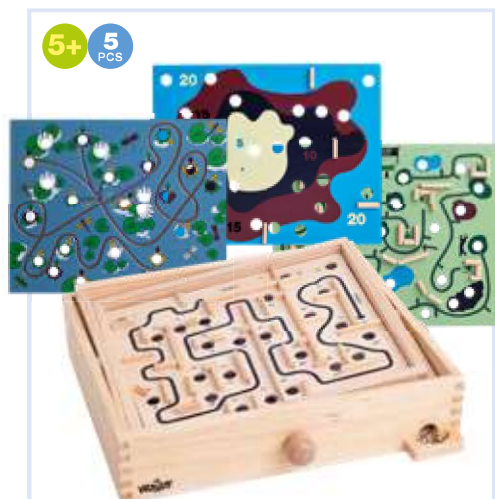
90915 Labyrint s naklápěcími rovinami s výměnnými deskami Wooden labyrinth with a ball → 28x23,5x6,5 cm → 30,5x8 cm ↑ 27 cm