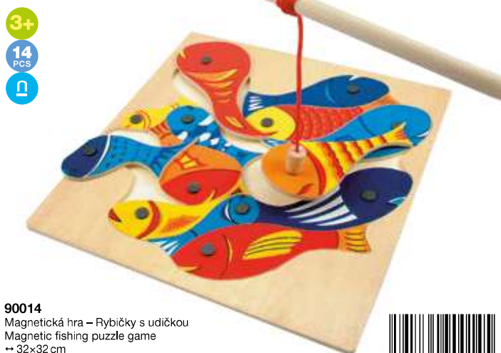
90014 Magnetická hra – Rybičky s udičkou Magnetic fishing puzzle game → 32x32 cm → 33x33 cm ↑ 3,5 cm