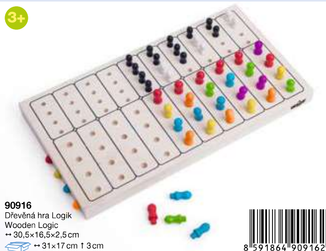
90916 Dřevěná hra Logik Wooden Logic → 30,5x16,5x2,5 cm → 31x17 cm ↑ 3 cm