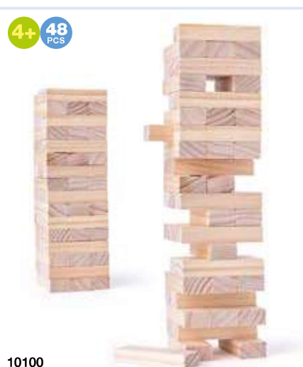
10100 Věž „Tonny“ – přírodní Tower „Tonny“ – natural wooden bricks → 7,5 cm ↑ 24 cm → 8,5x8 cm ↑ 27 cm