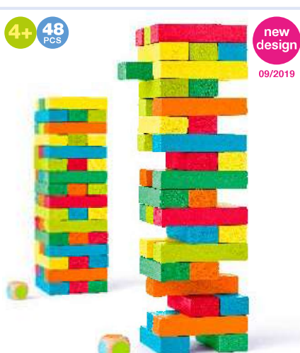
10210 Věž „Tonny“ – barevná Tower „Tonny“ – coloured wooden bricks → 7,5 cm ↑ 24 cm → 8,5x8 cm ↑ 27 cm