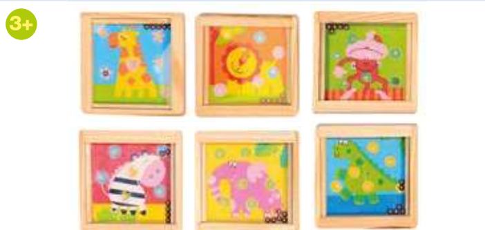
90767 Kuličkové hry – Africká zvířátka Ball puzzles – African animals → 5,5 x 5,5 cm