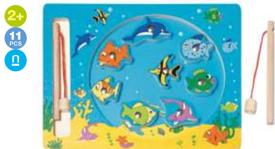
90026 Magnetická hra – Moře Magnetic fishing game – sea life → 30x23 cm → 30x23 cm ↑ 5 cm