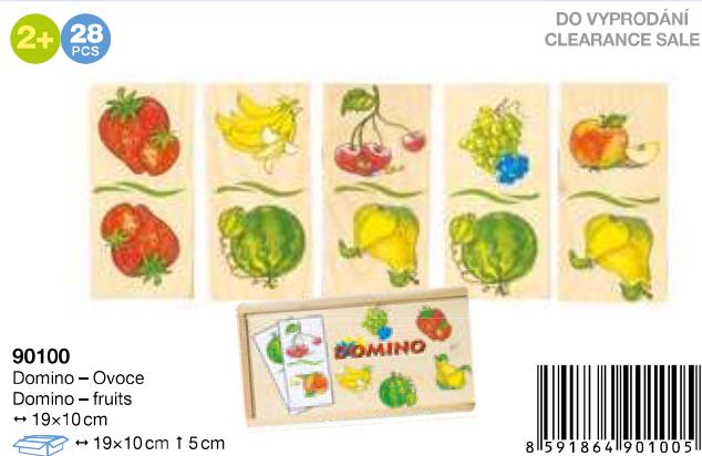
90100 Domino – Ovoce Domino – fruits → 19x10 cm → 19x10 cm ↑ 5 cm